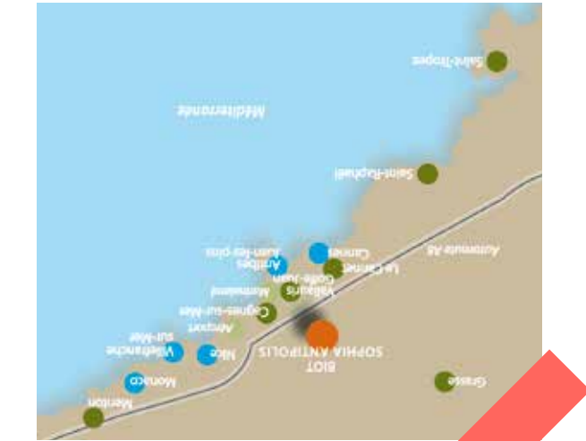
PLAN DE SITUATION SUR LA CÔTE D'AZUR

VENIR À BIOT - En provenance de Cannes, prendre la sortie Antibes Est n°44 - En provenance de Nice, emprunter la sortie Villeneuve-Loubet n°46 et suivre les panneaux de signalisation jusqu'à Biot. - Nombreux parkings gratuits à votre disposition. En train : arrêt gare de Biot (puis ligne de bus 10 jusqu'à Biot village). Aéroport Nice-Côte d'Azur à 15 minutes.